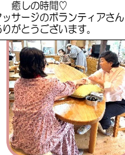
癒しの時間♡ アロママッサージのボランティアさん いつもありがとうございます。

※休日の土曜日曜・祝日の『暮らしの保健室』利用希望やご相談について 『暮らしの保健室』を利用希望の方、またはご相談を希望の方は事前の予約を お願いします。ご希望の方は、事務局(0985)53-6056までお電話ください。