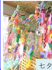
七夕飾りを作りました☆