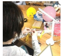
早速ライトを使っています♡ありがとうございます。

昨年度キャンペーンでいただいた寄付ではさみや、ライトなどを購入しました。針を使う際に「よくみえるわ～」と喜んでいらっしゃいました。