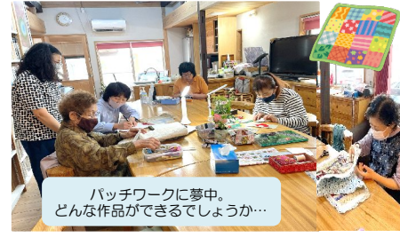
パッチワークに夢中。どんな作品ができるでしょうか…

開催日…月・水 曜日 時間…10時半～15時 利用料…400円 おやつ代…100円 【初回ご利用の方は、 利用料とおやつ代は無料です】