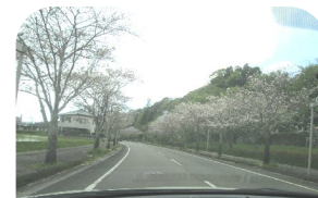
車窓からみる桜もキレイでした～

さわやかな風に吹かれて、こいのぼりが気持ちよさそうに泳ぐ季節になりました。 ゆるりサロンのボランティアさんが植えてくれた花々も、とてもきれいに咲いています。4月のゆるりサロンでは、県立看護大学までお花見ドライブに行きました。そのあとは、楽しみにしていたランチへ♪「おいしかった～」とみなさん笑顔でした。